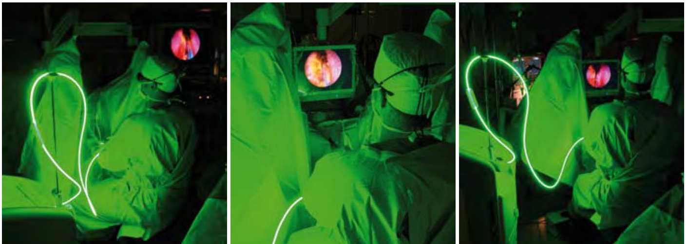
Photoselektive Vaporisation der Prostata – Situs im OP

Die Prävalenz der histologischen benignen Prostatas hyperplasie (BPH) nimmt mit steigendem Lebensalter pro Dekade um etwa 15 Prozent zu, sodass 90 Prozent der 85-jährigen Männer im pathologischen Sinne davon betroffen sind, von denen allerdings nur 25 bis 30 Prozent eine Therapie benötigen. Rund 30 Prozent aller Männer im Alter von über 65 Jahren stehen unter oraler Antikoagulation, des weiteren bringt eine erhöhte Lebenserwartung vermehrte Komorbiditäten mit sich. Einen Goldstandard der instrumentellen Therapie der symptomatischen BPH stellt auch noch im Jahr 2009 die konventionelle transurethrale Resektion der Prostata (TURP) dar. Die Methode wurde als minimal invasive Alternative zur offenen Prostatektomie eingeführt, ist aber auch mit einem nicht zu vernachlässigbaren Risiko an potentiellen Komplikationen verbunden. In einer im Jahr 2008 publizierten Multicenterstudie mit über 10.000 Patienten zeigte sich eine kumulative Morbidität von 11,1 Prozent bei einer Transfusionsrate von 2,9 Prozent, die sich bei einem Resektionsgewicht von 60g auf 9,5 Prozent erhöht, das Risiko für ein TUR-Syndrom lag bei 1,4 Prozent (>60g: 3,0 Prozent); die Mortalität von insgesamt 0,1 Prozent erhöhte sich bei größeren Drüsen auf 0,71 Prozent. Diese Daten stammten aus 44 zumeist nichtakademischen urologischen Abteilungen in