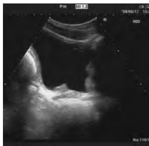
Sonographische Darstellung einer Prostataloge einen Monat nach PVP

••• 59 Patienten (24,1 Prozent) mit einem durchschnittlichen Alter von 71,2 Jahren (48,9-89,6) waren präoperativ katheterpflichtig, das mittlere Prostatavolumen betrug 46,3ml (14-130) bei einer Operationsdauer von 58 Minuten (10-125). 71 Männer wurden als ASA 3 eingestuft, 48 wurden unter laufender Antikoagulation operiert, dies entspricht gemeinsam einem Drittel der Patienten (35,5 Prozent).